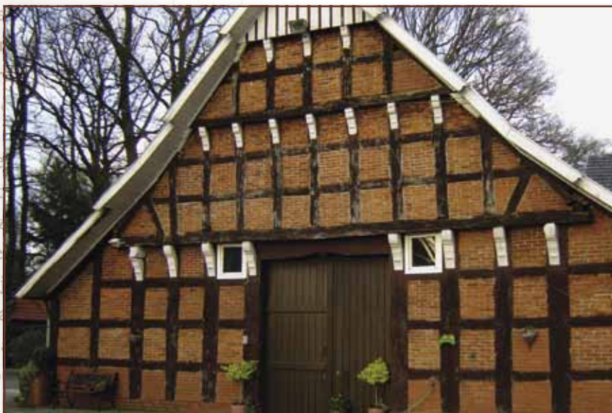
"Hof Emke", te Drantum, waarvan de historie teruggaat tot 1498.