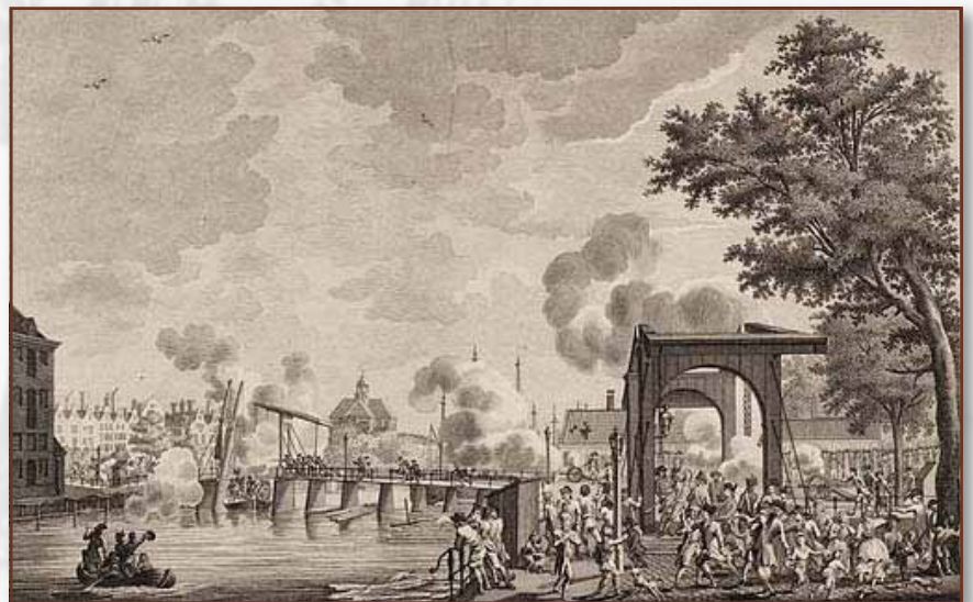
De vermeestering van Kattenburg (1787). IJgracht en Prins Hendrikkade met rechts de brug over de Schippersgracht.

van Den Bosch waren overigens sterk voor de patriotten. In 1787 moesten ze daarvoor boeten toen de Pruisen intervenieerden ten gunste van Willem V en zijn vrouw Wilhelmina van Pruisen. Zoals gezegd was Willem V een zwakke stadhouder die niet opgewassen was tegen de patriotten. Hij had zich uit Den Haag teruggetrokken en woonde in Nijmegen.