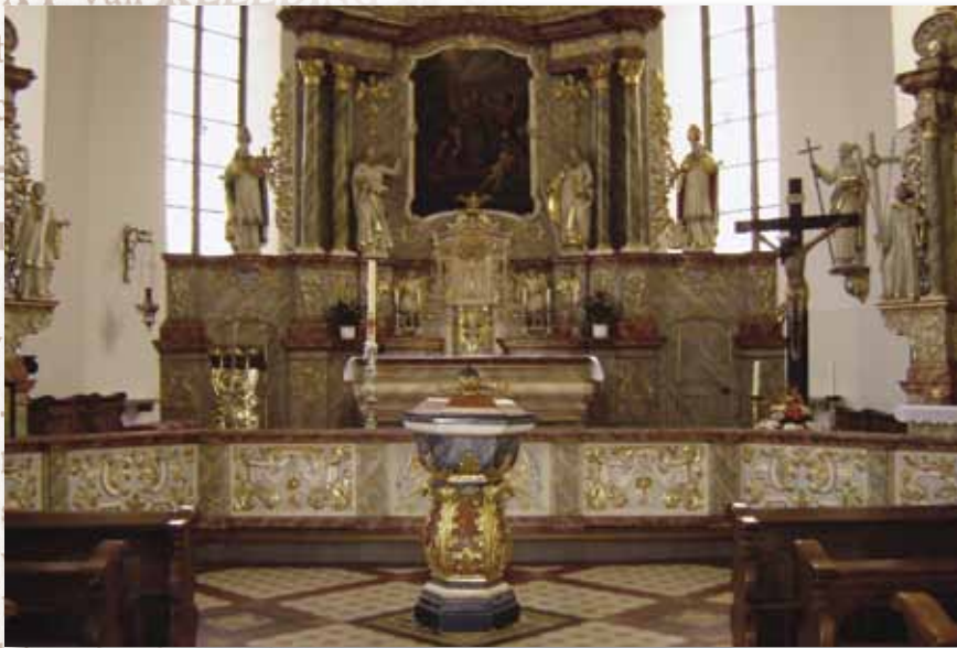
Doopvont van de Andreas Kirche te Cloppenburg