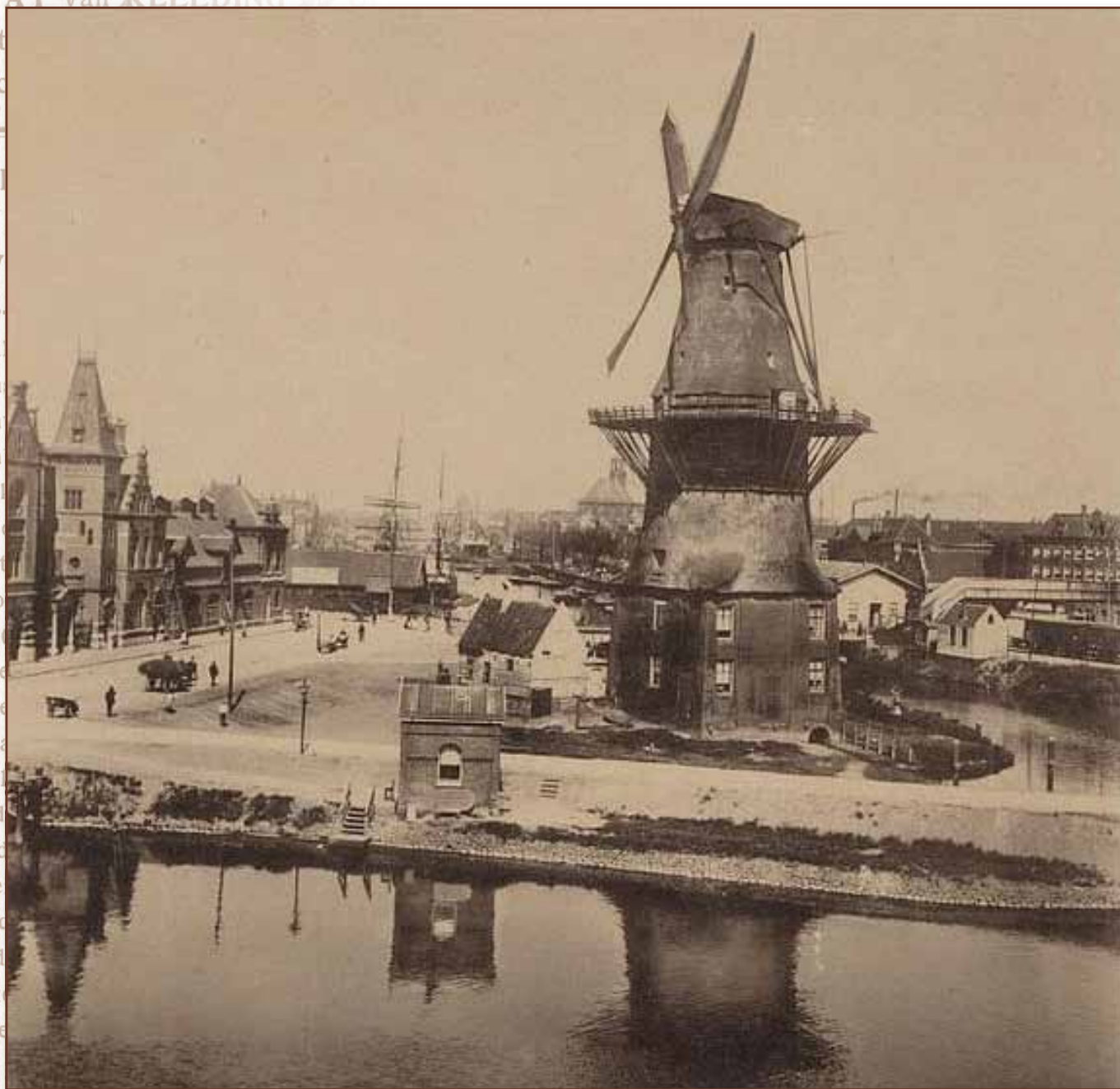
Circa 1900: Funenkade 5 met molen De Gooyer. Links Zeeburgerstraat. De molen is in 1930 gerestaureerd.