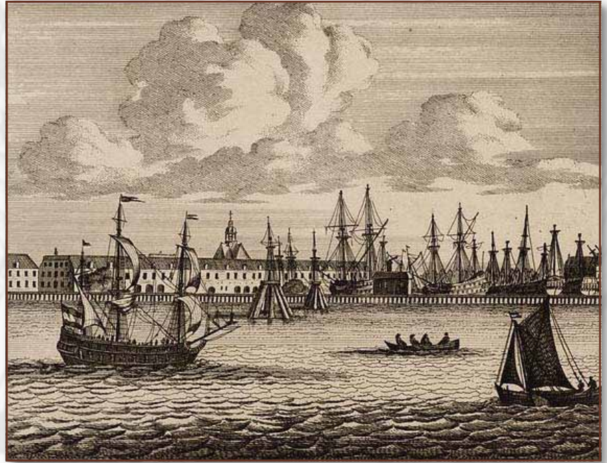
Gezicht vanuit het IJ op de Admiraliteitswerf op Kattenburg